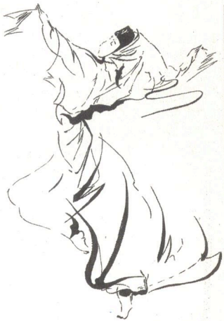
Le Samadeva permet d'avoir accès à une dimension spirituelle

La connaissance de ces liens entre zones, organes, systèmes et fonctions permet de remonter plus facilement à certaines causes originelles des maladies et, surtout, de savoir quel type de techniques de la médecine derviche mettre en œuvre (mouvements, concentration, visualisation, massage...).